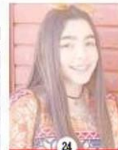
24 POLICIA CONFÍA FGE EN SENTENCIA CONDENATORIA EN CASO DIANA