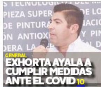
GENERAL EXHORTA AYALA A CUMPLIR MEDIDAS ANTE EL COVID 10