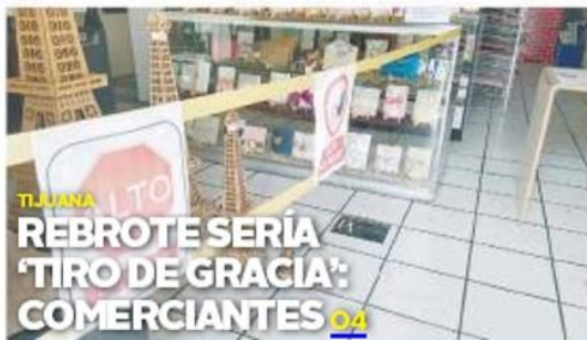
TIJUANA REBROTE SERÍA 'TIRO DE GRACIA': COMERCIANTES 04

El Secretario de Salud señaló que se tiene un incremento en pacientes hospitalizados, intubados, así como los casos activos. PÁG. 02